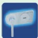
DB Standardschloss Doppelbart- Hochsicherheitsschloss EN 1300 Klasse A.