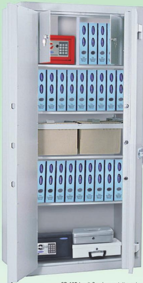
SB-195-L mit Sonderausstattung / with special equipment