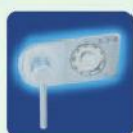
a) MC Mechanisches Zahlen- kombinationsschloss EN 1300 Klasse A