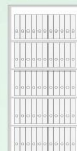
Kanzlei SB-195 L 55 Ordner / Folder