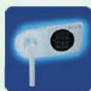
b) EL Elektronisches Sicher- heitsschloss EN 1300 Klasse B (ohne Revision) inkl. 9 Volt Blockbatterie.